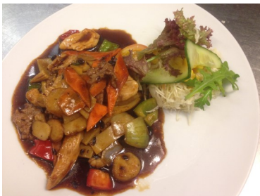
116. Si zjiu chapgam m/ris (Salat, kylling, svinekjøtt, oksekjøtt, grønnsaker, litt sterk hjemmelaget saus med ingefær, hvitløk og sorte bøn- ner) 195,-