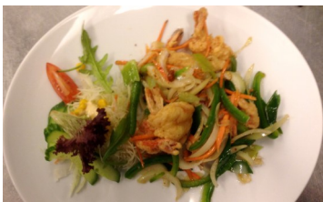
58. Innbakte kongereker med five-spice krydder og chilisalt og jiuyimsaus 255,-