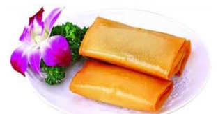
2. Små vegetariske vårruller 50,-