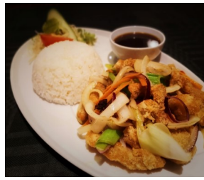
106. Jiuyim gailau m/ ris (Innbakt strimlet kyllingfilet, five-spice krydder, chilisalt, grønnsaker, jiuyim saus) 200,-