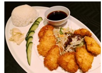
103: Meigik Yu m/ris (Innbakte fiskefileter, meigik-saus, salat syrlig ingefær) 175,-