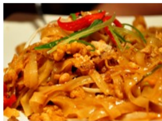
73. Pad Thai (søtlig chilismak) (Stekte risnudler, svinekjøtt, egg, reker, grønnsaker) 185,-