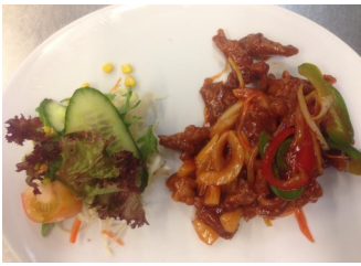
117. Zhongsik Yogpin m/ris (Salat, innbakt skivet svinekjøtt på kinesisk vis) 185,-