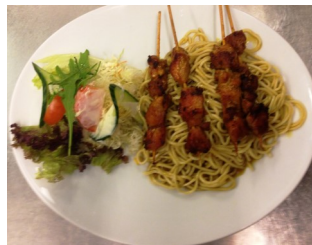
108. Marinert kylling i karri på spyd m/sataynudler og salat 200,-