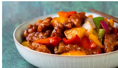
19. Innbakt svinekjøtt med BBQ-saus 220,-