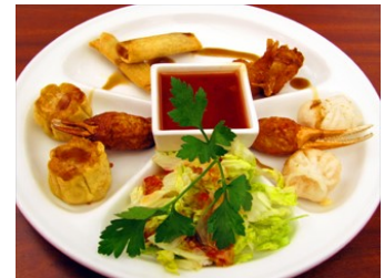
105. Kinesisk tapastallerken m/ris (vårruller, kongereker, løkringer, wonton, salat, søt chilisaus) 200,-