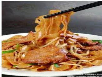
74. Gonchao Ngauho (Stekte risnudler, oksekjøtt, grønnsaker) 195,-