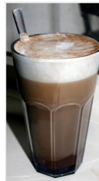
Kaffe mocha m/vaniljeiskule 80,-