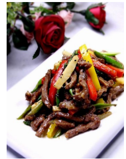
Nr. 27: Innbakt strimlet oksekjøtt m/søt peppersaus og sesam- frø 220,-